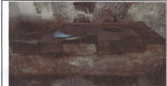
Foto 2: Sustrucción de estufa rural (completa) incluye chimenea y plancha de metal