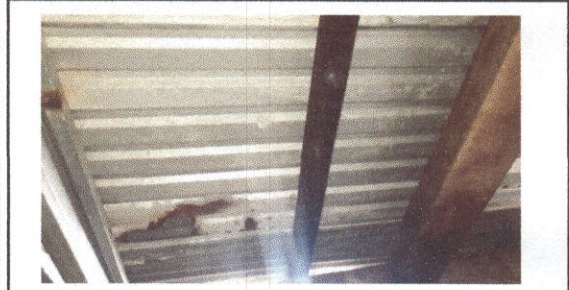
Foto 1: Sustrucción de lámina, por lámina troquelada aluzinc calibre 26 Y Sustrucción de estructura de soporte de madera, por metal